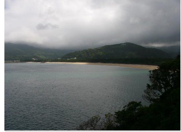
白砂青松: 風光明媚な内之浦ですが……

内之浦湾遊泳禁止 ●急傾斜で深くなっている。 ●離岸流に巻き込まれることがある。 ※離岸流は目で見つけることができず、泳げる人でも脱出が困難である。