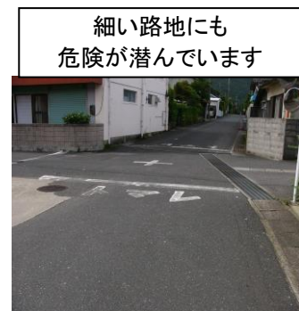
細い路地にも危険が潜んでいます