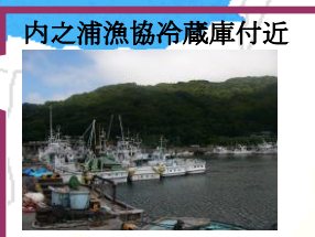
内之浦漁協冷蔵庫付近