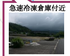
急速冷凍倉庫付近