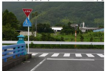
道路標識をきちんと確認